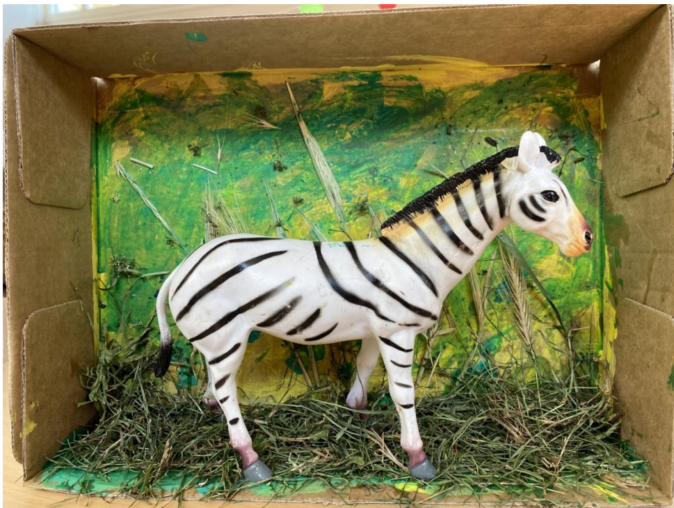
Thema dieren, een verblijf voor de zebra