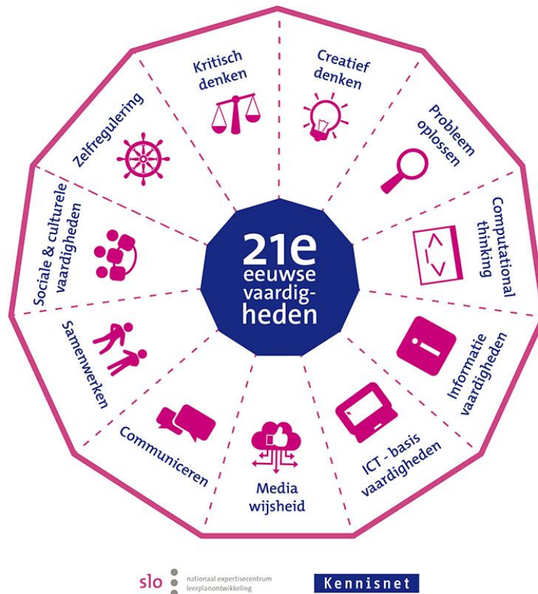
Figuur 3.2 21 e eeuwse vaardigheden, SLO & Kennisnet

Inhoudelijk toont de cirkel van OntwikkelingsGericht Onderwijs overeenkomsten met het model van 21e -eeuwse vaardigheden, ontwikkeld door de Stichting Leerplan Ontwikkeling en Kennisnet. Dit model omschrijft 11 vaardigheden die leerlingen in hun latere leven nodig hebben. Allemaal vaardigheden die binnen ons OntwikkelingsGericht Onderwijs in de thema's aan bod komen. Het gaat om vaardigheden als 'kritisch denken', 'creatief denken', 'probleemoplossen', 'ICT-basisvaardigheden', 'informatievaardigheden' en 'computational thinking'. Die laatste drie vormen samen met 'mediawijsheid' de digitale vaardigheden.